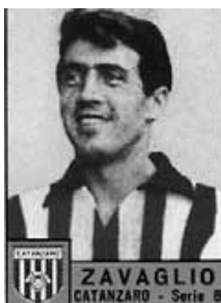
Nel Catanzaro nel 1964-65