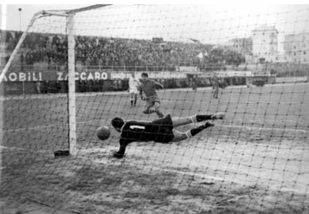
Gol di testa di Zavaglio con la maglia del Catanzaro contro il Padova nel torneo 1964-65